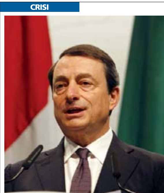
Mario Draghi, governatore di Bankitalia

L'INDAGINE. Lo studio evidenzia come, rispetto al 2006, le imprese abbiano speso circa 1,7 miliardi di euro in più per gli oneri amministrativi, +4,4% per ciascuna azienda. Una crescita, comunque, inferiore a quella dell'inflazione. Il costo più alto è sostenuto dalle imprese dei servizi, che pagano in media circa 12.700 euro, contro gli 11.700 euro sborsati dalle aziende manifatturiere. Per il 27,8% delle imprese i costi dei principali adempimenti amministrativi sono aumentati rispetto al 2007 mentre per il 63,6% sono rimasti invariati. «I costi che le imprese pagano per gli adempimenti sono ancora molto elevati», spiega il presidente di Unioncamere, Ferruccio Dardanelli - è necessario procedere con la semplificazione amministrativa e diffusione della telematica». E proprio l'informatica registra un boom per l'espletamento degli adempimenti amministrativi: oltre l'85% delle imprese ha usato almeno qualche volta modalità telematiche (46,5% nel 2006) e sale al 44,3% (dal 16,3% nel 2006) la quota di imprenditori che utilizza solo procedure informatiche.