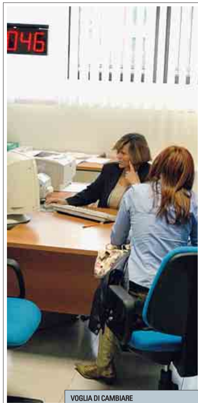
VOGLIA DI CAMBIARE In tanti vorrebbero un'occupazione diversa

In vista dell'inizio della stagione, quindi, il Codacons fornisce alcuni consigli per acquistare in tutta sicurezza: oltre a conservare sempre lo scontrino e a girare per i negozi, invita a diffidare degli sconti superiori al 50% e a servirsi preferibilmente nei negozi di fiducia. Inoltre ricorda che le vendite devono essere realmente di fine stagione e che sulla merce è obbligatoria presenza del cartellino che indica il vecchio prezzo, quello nuovo ed il valore percentuale dello sconto applicato.